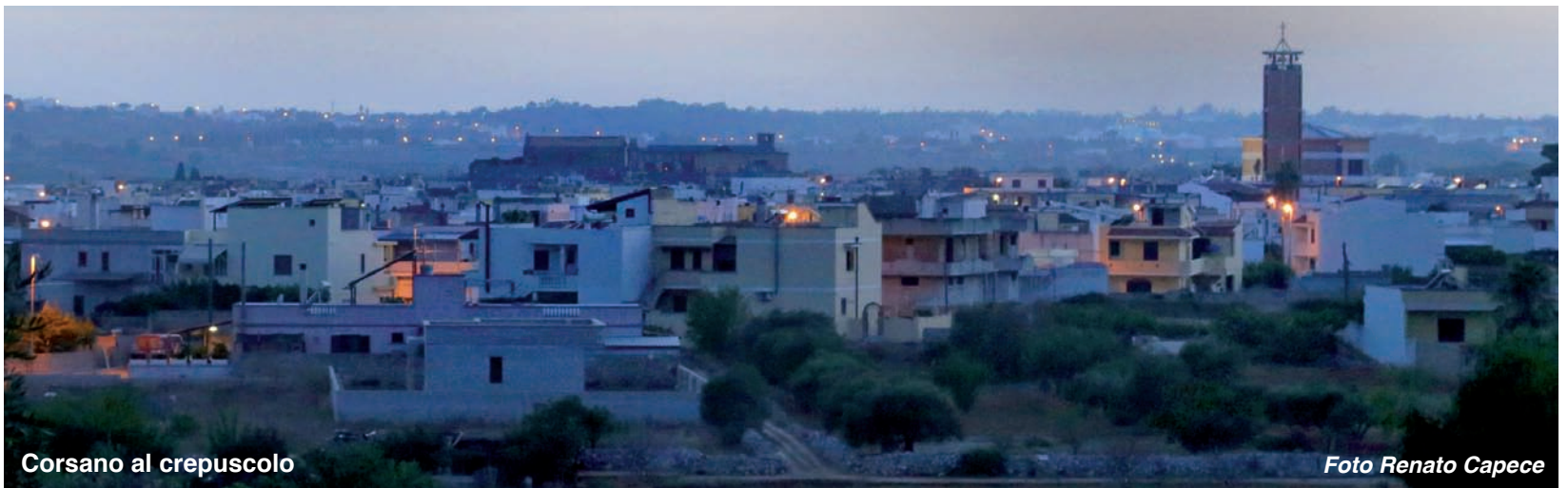
Corsano al crepuscolo

ANNO XL N° 1 - Quadrimestrale di Informazione, Cultura, Politica, Sport - Autoriz. Trib. di Lecce n° 420 del 18.01.1988 - Sped. in abb. post. gr.IV - 70% Settembre 2015